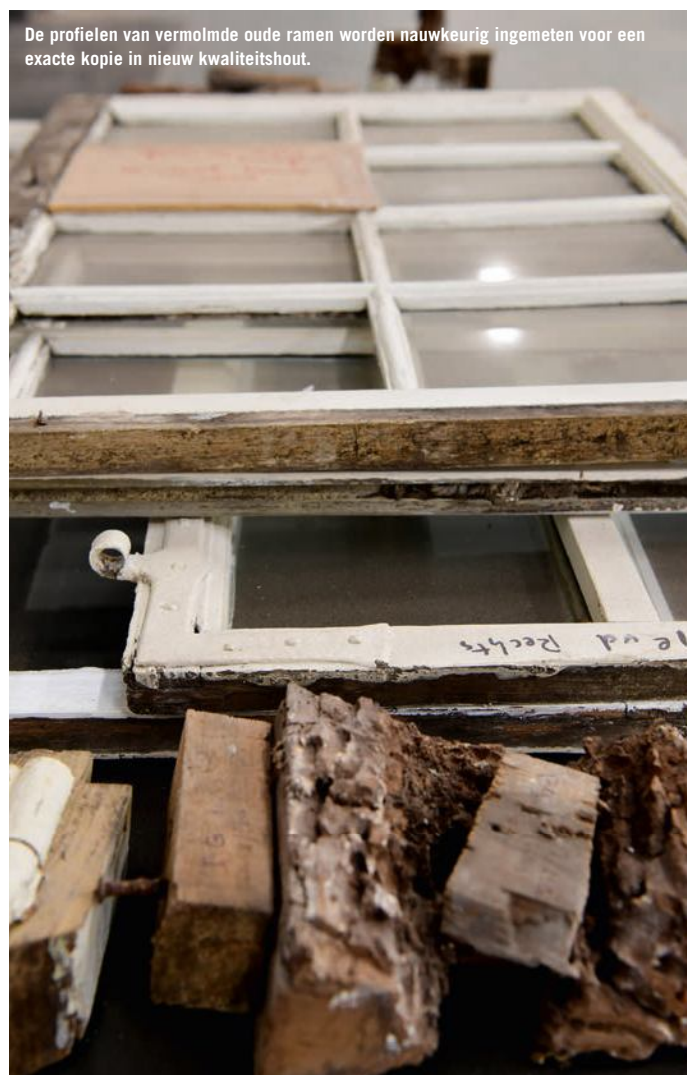
De profielen van vermolmde oude ramen worden nauwkeurig ingemeten voor een exacte kopie in nieuw kwaliteitshout.

Dankzij de cnc-techniek is het esthetisch timmerwerk betaalbaar en kan Van de Plas zijn particuliere klanten blijven bedienen die een fraai kozijn in de gevel wensen. Rolf gaat er niet specifiek de boer voor op. Dit type klant vindt het bedrijf via via. “Ze zien ergens kozijnen die ze geweldig vinden en vragen waar ze vandaan komen.” Maar dat is niet het enige voordeel van moderne technologie in een ambachtelijke omgeving. Rolf: “Ik durf de stelling wel aan dat toepassing van de cnc-techniek een voorwaarde is om het ambacht te behouden. Ik heb daarover gesproken tijdens een symposium over het ambacht. Er zit veel kennis opgeslagen in moderne machines. We zijn voor de overdracht minder afhankelijk van die ene medewerker met een schat aan ervaring. En verder zou het merendeel van de jonge mensen die nu bij ons bedrijf werken, ons ambacht niet omarmd hebben als we nog steeds zouden leunen op oude technologie. Vroeger was het normaal dat onze vakmensen na het avondeten nog een paar uur aan de slag gingen. En ook op zaterdagmorgen werd