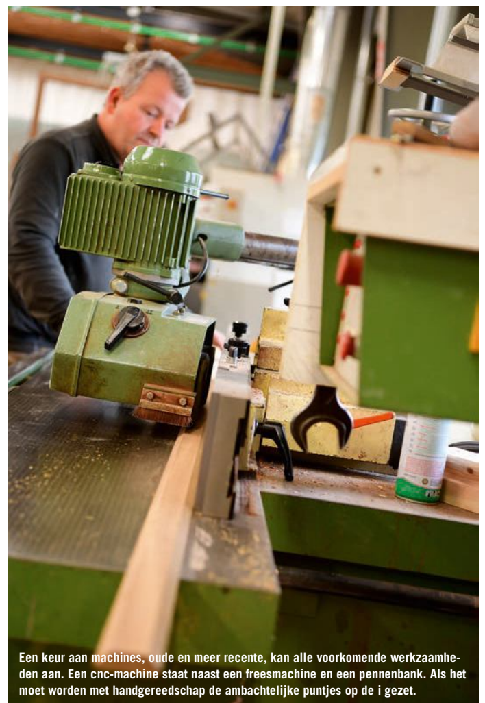
Een keur aan machines, oude en meer recente, kan alle voorkomende werkzaamheden aan. Een cnc-machine staat naast een freesmachine en een pennensbank. Als het moet worden met handgereedschap de ambachtelijke puntjes op de i gezet.