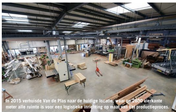
In 2015 verhuisde Van de Plas naar de huidige locatie, waar op 2800 vierkante meter alle ruimte is voor een logistieke inrichting op maat van het productieproces.

In 2005 was het bedrijf gevestigd aan de Kreitenmolenstraat in het dorpscentrum van Udenhout. Dat was al zo sinds 1860. Een paar hokkerige schuren, een kantoortje en een fabriek van in totaal 350